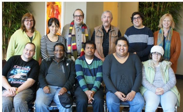
카메라를 향해 웃고 있는 DD Ombuds 직원 및 자문위원회 위원들.

아동 또는 취약한 성인의 학대, 방치, 유기 또는 재정적 착취가 의심될 경우, 1-866-363-4276으로 전화하십시오. (1-866-ENDHARM).